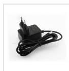
Alimentatore 5Vdc 1A